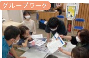
クラスメートと意見交換をする事で理解が深まります。