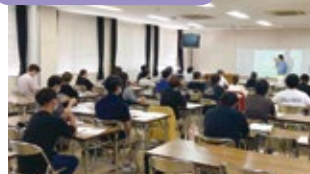
スクーリング2年生