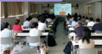
スクーリング1年生