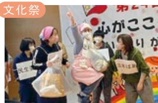
楽しい学校生活の思い出になりました!