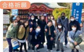
クラス全員で合格できますように...