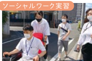
実践の場で、様々な体験を通じて深い学びをしました。