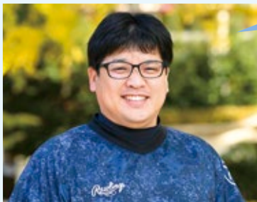
特定非営利活動法人 オレンジ