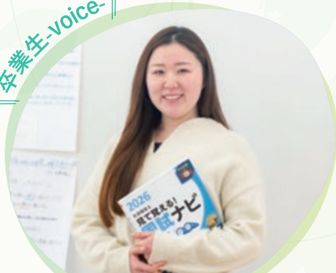
指定就労継続支援B型事業所 椿の会