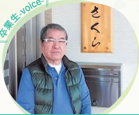
障害者グループホーム 八月のさくら