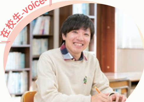
合同会社きょうめい 相談サポート音